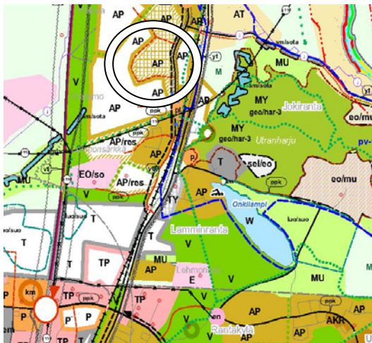
Ote Joensuun seudun yleiskaavasta

Alueella on voimassa myös ympäristöministeriön 29.12.2009 vahvistama Joensuun seudun yleiskaava 2020, jossa alue on merkitty asuntoalueeksi (AP).