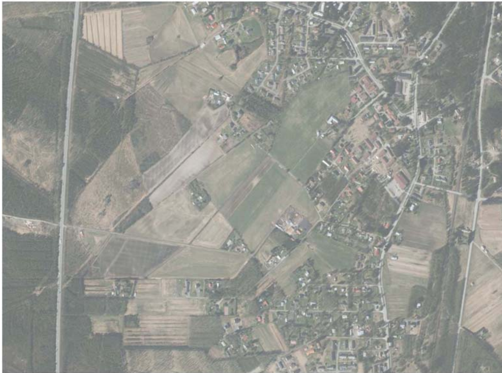
Ilmakuva kaavan laajennusalueesta

Lehmon asemakaavan muutoksen ja laajentamisen tarkoituksena vanhan Lehmon alueella on selkeyttää alueen kiinteistöjako, mahdollistaa alueen kuivatus, kevyenliikenteen verkoston toteuttaminen ja alueen täydennysrakentaminen.